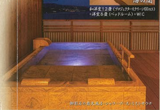
御影石の露天風呂・シャワーブース・ミストサウナ

和洋室12畳(プロジェクター100inch) +洋室8畳(ベッドルーム)+WIC