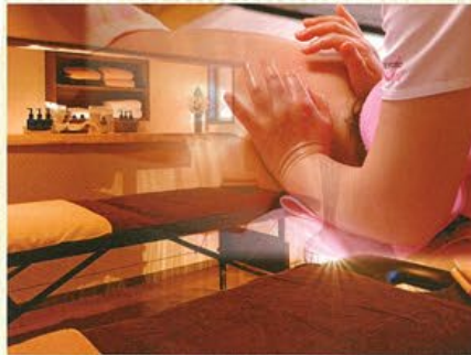
アロマハンドリラククス・体にやさしいエステ