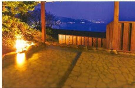
饗切風呂「海音の森」